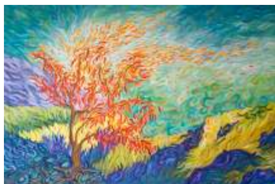
Eveline van Eijk

schilderijen en tekeningen marjolijnpeeters.nl