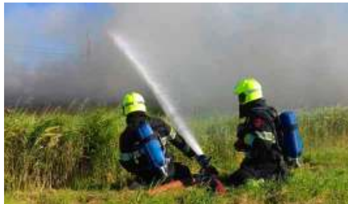
Ook een berm kan makkelijk vlam vatten

De ploeg heeft de jongens laten vertellen wat ze nou eigenlijk gedaan hadden. Op hun beurt hebben ze de jongens uitgelegd wat de brandweer doet en waarom het in brand steken van iets niet verstandig is. Als de brandweer gealarmeerd wordt voor het in de brand steken van een klein iets als een lesboek, kunnen de brandweermannen en -vrouwen op dat moment misschien minder snel bij een grotere brand zijn waar mensen of dieren in nood zijn. Door de warmte en droogte op dit moment kan een klein vonkje al genoeg zijn om hele gebieden vlam te